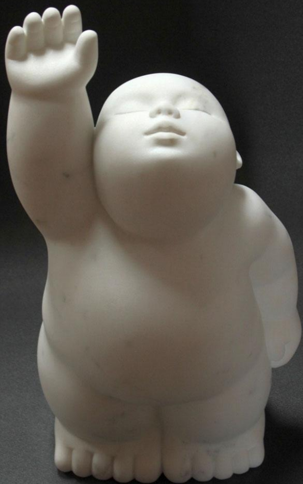
Tocant el cel Marbre de Carrara 41 x 24 x 18 cm