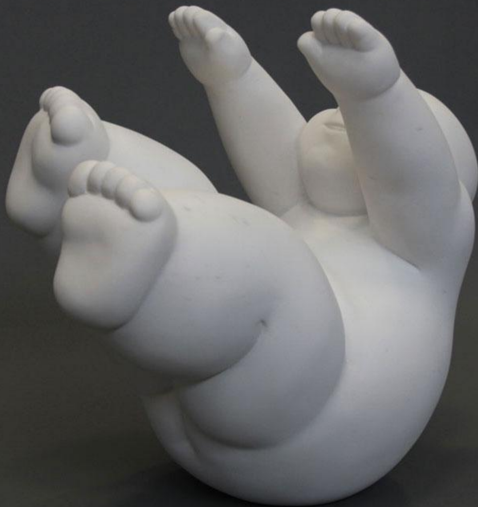
La caiguda Marbre de Sivec 22 x 33 x 36 cm