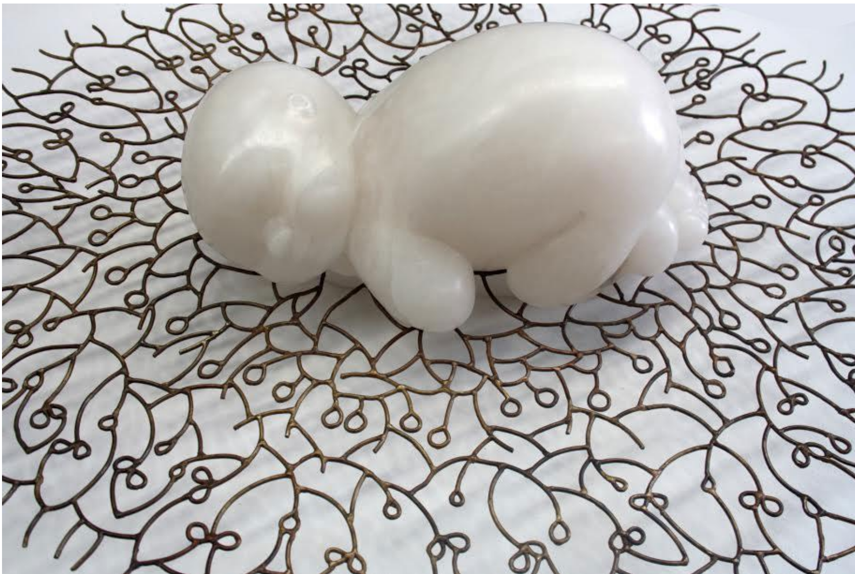
Confiança Alabastre i bronze 68 x 55 x 14 cm