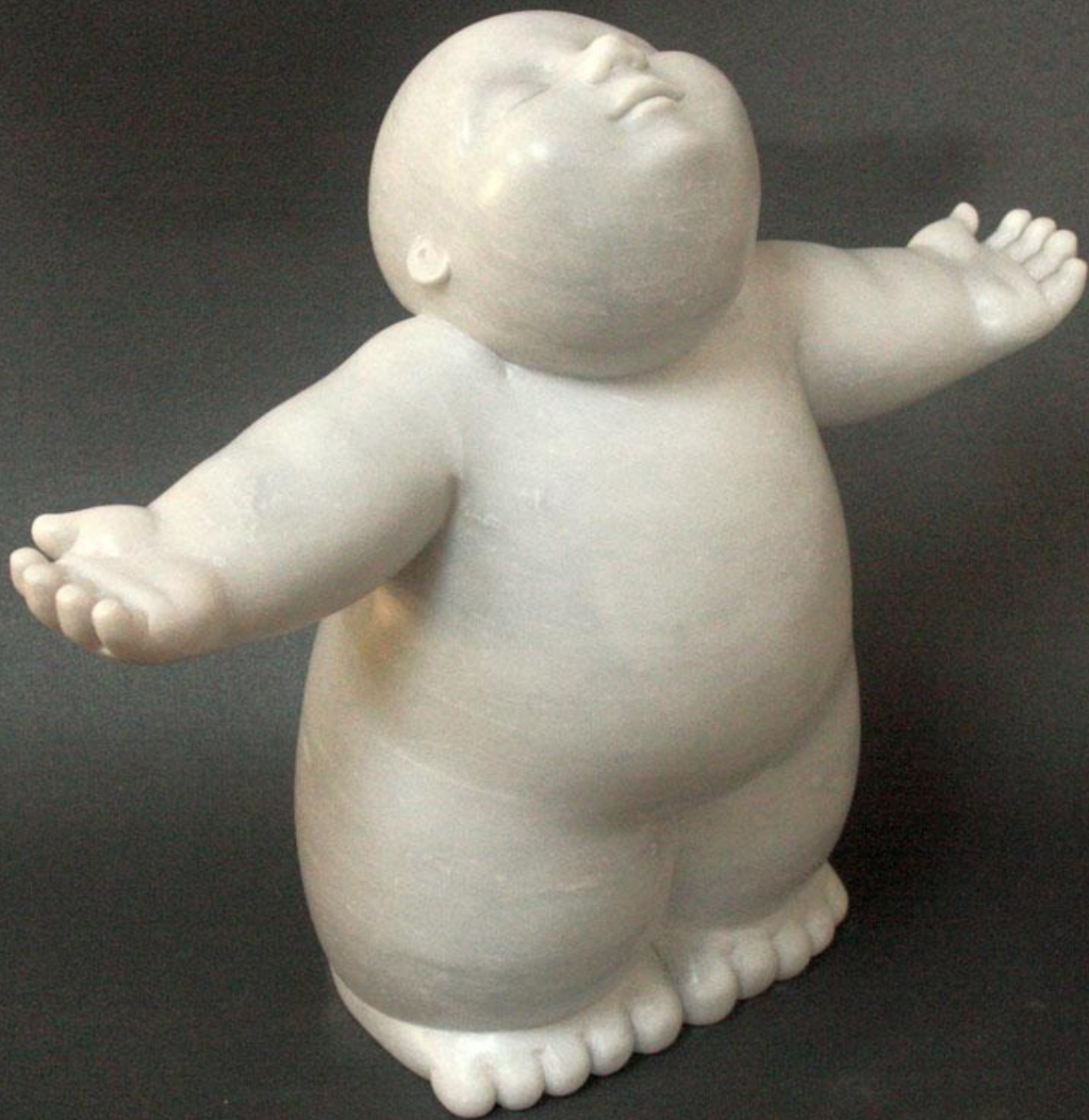
Pluja Marbre gris 45 x 19 x 40 cm