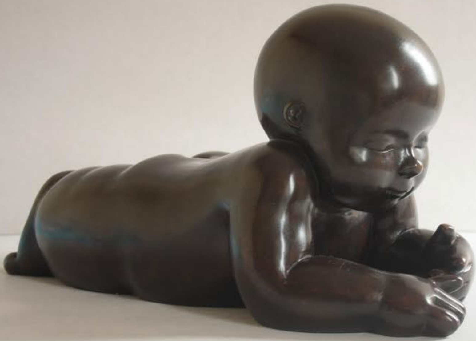
Petites choses Bronze 23 x 46 x 21 cm