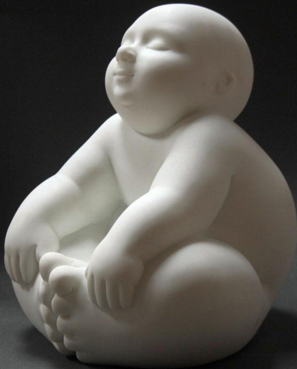
Brisa Marbre blanc de Carrara 34 x 30 x 28 cm