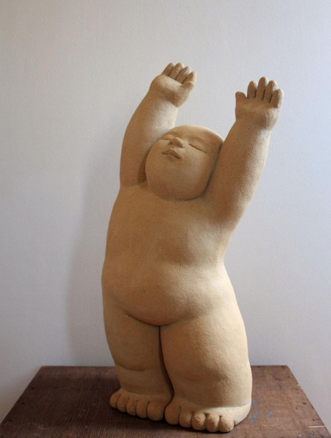
Música I Ceràmica 60 x 34 x 20 cm