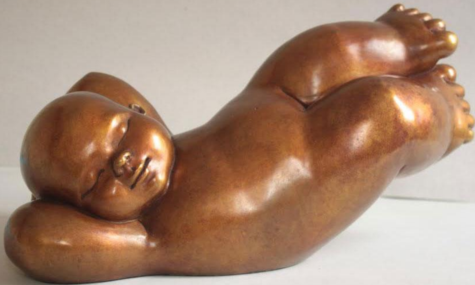
Volar Bronze 23 x 42 x 20 cm